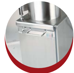
Porte étanche avec joint arrondi pour plus d'hygiène

Waterproof door with rounded joint to improve the hygiene