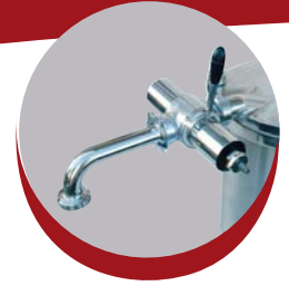
Portionneur manuel Manual portioner