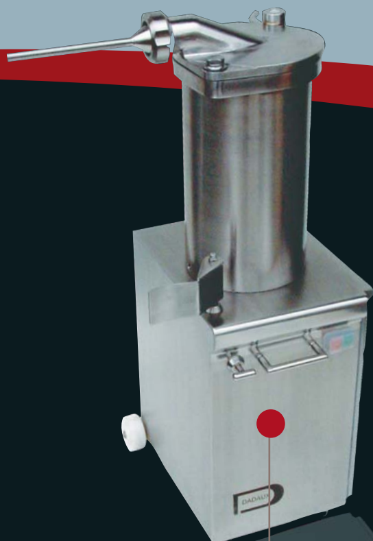
Poussoir PH 13