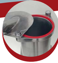
Couvercle PH13 ouvert Cover PH13 opened