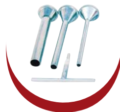
Accessoires 100 % inox 18-10 Accessories 100 % stainless steel