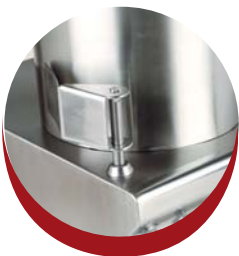
Genouillère repliable Foldable knee piece

Moteur 220/380 V triphasé 50/60 hz - Option : moteur monophasé