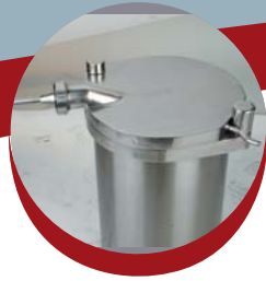
Couvercle à fermeture automatique Automatic closing of cover.