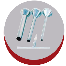
Accessoires 100 % inox 18-10 Accessories 100 % stainless steel