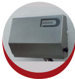
Protection de l'écran contre les projections d'eau sous pression Screen protection against the water