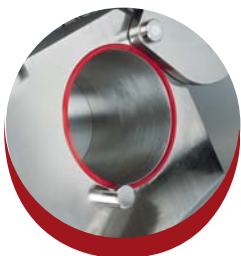
Cylindre 40 Litres 40 litres cylinder