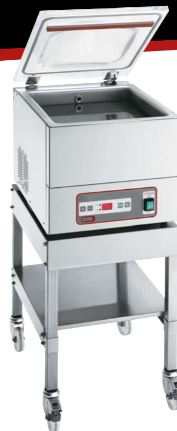
"D400 + socle"