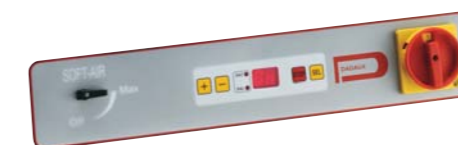
Panneau de commande D500-60 avec option soft air Control board with soft air option