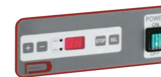
Panneau de commande D400 Control board of D400