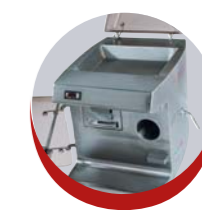
Position nettoyage Cleaning position