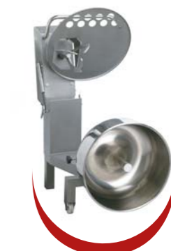
Position nettoyage Cleaning position