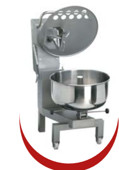
Position chargement Loading position